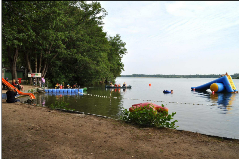
Abbildung 1: Foto der Badestelle